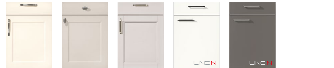
CHALET 883 PG 9 Lack, Magnolia matt CHALET 881 PG 9 Lack, Sand matt YORK 901 PG 9 Echtholz, Seidengrau lackiert ARTIS 938 PG 10 Glasoptik, Alpinweiß matt ARTIS 937 PG 10 Glasoptik, Titiano matt CHALET 883 PG 9 Lacquer, honed ivory CHALET 881 PG 9 Lacquer, honed sand YORK 901 PG 9 Genuine wood, lacquered satin grey ARTIS 938 PG 10 Glass appearance, alpine white matt ARTIS 937 PG 10 Glass appearance, Titiano matt