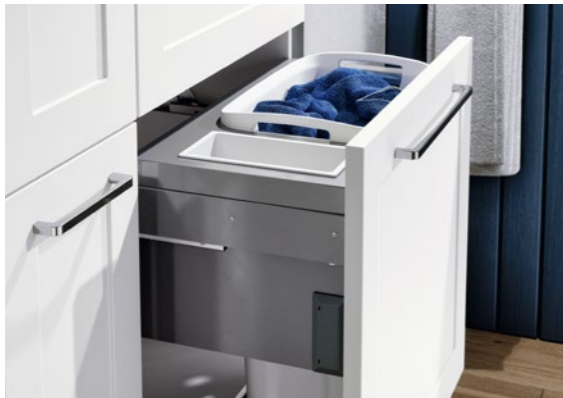
Midischrank Laundry Carrier Midi unit laundry carrier