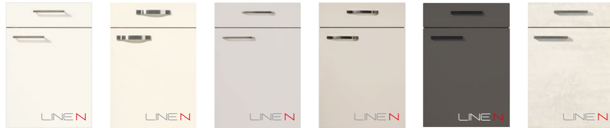
LASER 416 Weiß PG 2 LASER 418 Magnolia matt PG 2 LASER 417 Seidengrau PG 2 LASER 415 Sand PG 2 LASER 414 Vulkangrau PG 2 RIVA 891 Weißbeton Nachbildung PG 2 LASER 416 White PG 2 LASER 418 Ivory matt PG 2 LASER 417 Satin grey PG 2 LASER 415 Sand PG 2 LASER 414 Volcanic grey PG 2 RIVA 891 White Concrete reproduction PG 2