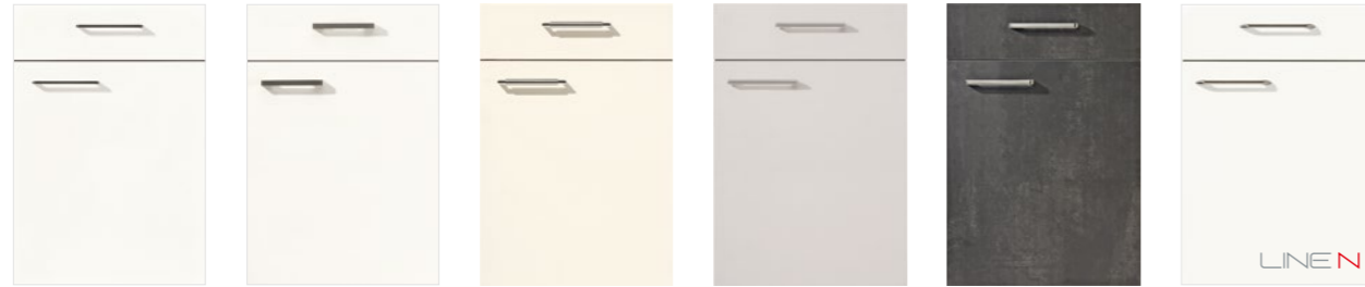
SPEED 244 Alpinweiß PG 1 SPEED 239 Weiß softmatt PG 1 SPEED 206 Magnolia softmatt PG 1 SPEED 259 Seidengrau PG 1 SPEED 288 Schwarzbeton Nachbildung PG 1 LASER 427 Alpinweiß PG 2 SPEED 244 Alpine white PG 1 SPEED 239 White softmatt PG 1 SPEED 206 Ivory softmatt PG 1 SPEED 259 Satin grey PG 1 SPEED 288 Black Concrete reproduction PG 1 LASER 427 Alpine white PG 2

Fronten, die mit dem LINE N-Logo versehen sind, sind auch als grifflose Planungen lieferbar. Fronts marked with the LINE N logo are also available as handleless designs.