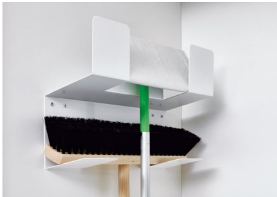
Besen- / Wischerhalter Laundry-Area Broom / mop holder, laundry area