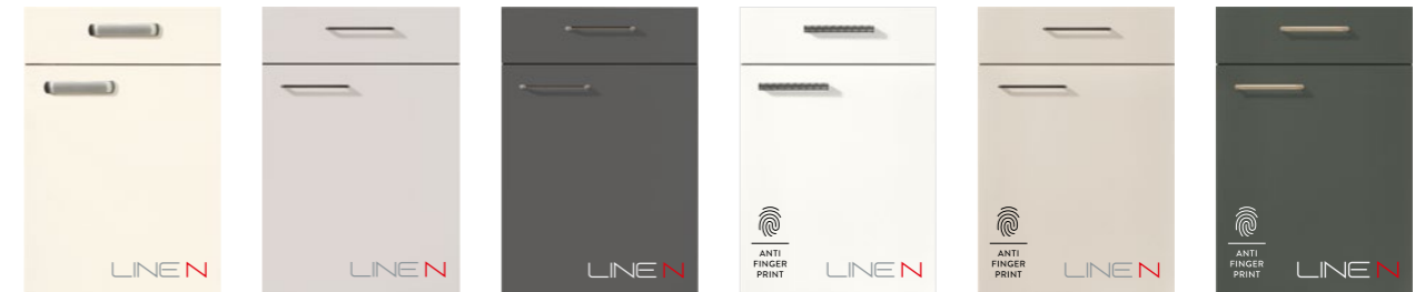
FLASH 452 Lacklaminat, Magnolia Hochglanz PG 3 FLASH 455 Lacklaminat, Seidengrau Hochglanz PG 3 FLASH 453 Lacklaminat, Schiefergrau Hochglanz PG 3 EASYTOUCH 967 Lacklaminat, Alpinweiß ultramatt PG 4 EASYTOUCH 969 Lacklaminat, Sand ultramatt PG 4 EASYTOUCH 964 Lacklaminat, Mineralgrün ultramatt PG 4 FLASH 452 Lacquered laminate, ivory high gloss PG 3 FLASH 455 Lacquered laminate, satin grey high gloss PG 3 FLASH 453 Lacquered laminate, slate grey high gloss PG 3 EASYTOUCH 967 Lacquered laminate, alpine white ultra matt PG 4 EASYTOUCH 969 Lacquered laminate, sand ultra matt PG 4 EASYTOUCH 964 Lacquered laminate, Mineral green ultra matt PG 4