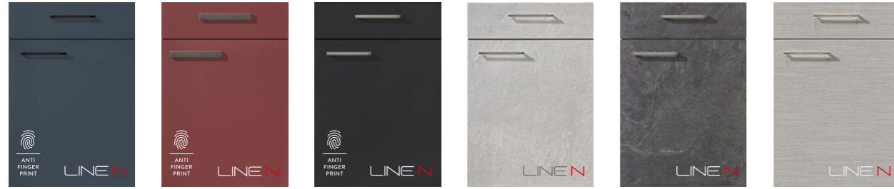
EASYTOUCH 966 PG 4 Lacklaminat, Fjordblau ultramatt EASYTOUCH 963 PG 4 Lacklaminat, Rostrot ultramatt EASYTOUCH 961 PG 4 Lacklaminat, Grafit schwarz ultramatt STONEART 304 PG 4 Schiefer steingrau Nachbildung STONEART 303 PG 4 Grauschiefer Nachbildung INOX 216 PG 4 Lacklaminat, Stahl gebürstet Nachbildung EASYTOUCH 966 PG 4 Lacquered laminate, Fjord blue ultra matt EASYTOUCH 963 PG 4 Lacquered laminate, rust red ultra matt EASYTOUCH 961 PG 4 Lacquered laminate, graphite black ultra matt STONEART 304 PG 4 Stone grey slate reproduction STONEART 303 PG 4 Grey slate reproduction INOX 216 PG 4 Lacquered laminate, brushed steel reproduction

Fronten, die mit dem LINE N-Logo versehen sind, sind auch als grifflose Planungen lieferbar. Fronts marked with the LINE N logo are also available as handleless designs.