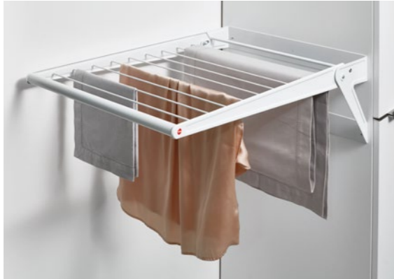
Wäschetrockner Laundry-Area Clothes drying rack, laundry area