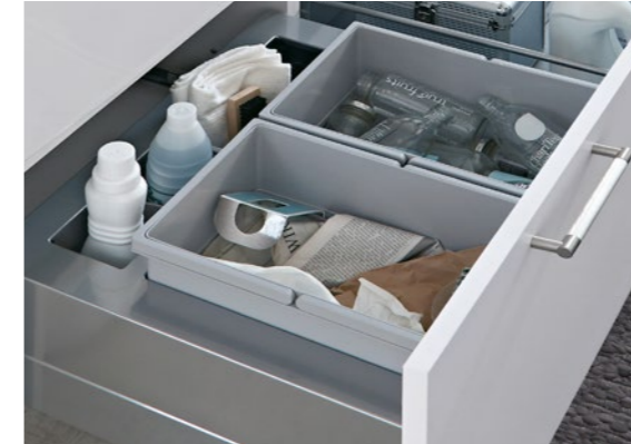
Mülltrennsystem Separato Waste separation system Separato