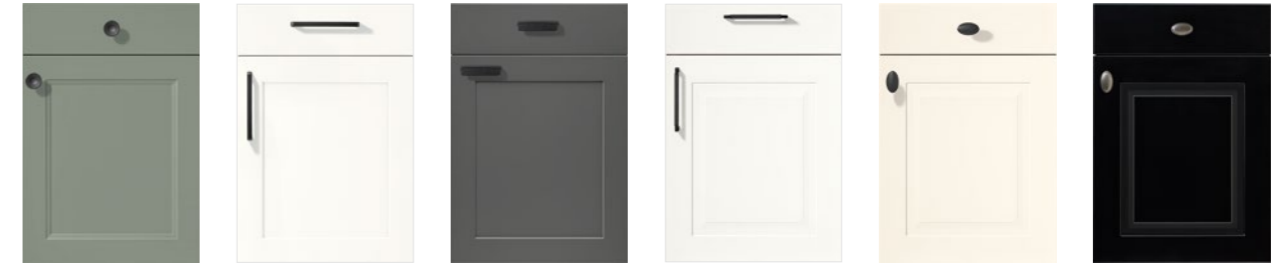
CASCADE 776 PG 7 Lacklaminat, Schilf NORDIC 782 PG 7 Lack, Weiß matt NORDIC 786 PG 7 Lack, Schiefergrau matt SYLT 847 PG 7 Lack, Alpinweiß matt SYLT 849 PG 7 Lack, Magnolia matt SYLT 851 PG 7 Lack, Schwarz matt CASCADE 776 PG 7 Lacquered laminate, reed green NORDIC 782 PG 7 Lacquer, honed white NORDIC 786 PG 7 Lacquer, Slate grey matt SYLT 847 PG 7 Lacquer, honed alpine white SYLT 849 PG 7 Lacquer, honed ivory SYLT 851 PG 7 Lacquer, honed black