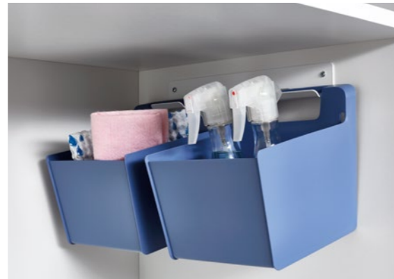
2 Utensilienbehälter mit Wandhalterung Laundry-Area 2 utensil containers with mounting brackets, laundry area