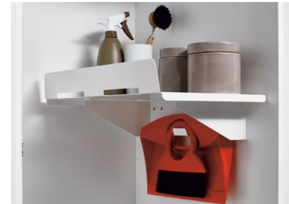
Ablage mit Kehrset Laundry-Area Shelf with dustpan set, laundry area