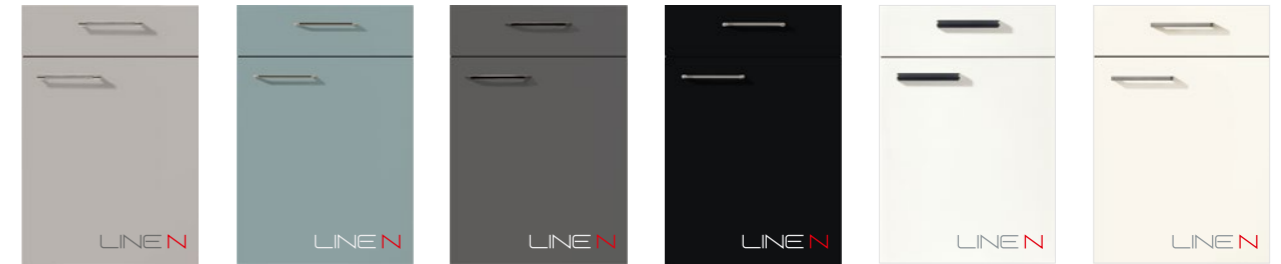
TOUCH 341 Lacklaminat, Steingrau supermatt PG 3 TOUCH 337 Lacklaminat, Aqua supermatt PG 3 TOUCH 334 Lacklaminat, Schiefergrau supermatt PG 3 TOUCH 340 Lacklaminat, Schwarz supermatt PG 3 FLASH 503 Lacklaminat, Alpinweiß Hochglanz PG 3 FLASH 450 Lacklaminat, Weiß Hochglanz PG 3 TOUCH 341 Lacquered laminate, stone grey supermatt PG 3 TOUCH 337 Lacquered laminate, aqua supermatt PG 3 TOUCH 334 Lacquered laminate, slate grey supermatt PG 3 TOUCH 340 Lacquered laminate, black supermatt PG 3 FLASH 503 Lacquered laminate, alpine white high gloss PG 3 FLASH 450 Lacquered laminate, white high gloss PG 3