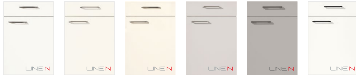
FASHION 168 PG 4 Lack, Alpinweiß matt FASHION 173 PG 4 Lack, Weiß matt FASHION 175 PG 4 Lack, Magnolia matt FASHION 171 PG 4 Lack, Seidengrau matt FASHION 165 PG 4 Lack, Steingrau matt FOCUS 470 PG 4 Lack, Alpinweiß Ultra-Hochglanz FASHION 168 PG 4 Lacquer, honed alpine white FASHION 173 PG 4 Lacquer, honed white FASHION 175 PG 4 Lacquer, honed ivory FASHION 171 PG 4 Lacquer, honed satin grey FASHION 165 PG 4 Lacquer, honed stone grey FOCUS 470 PG 4 Lacquer, alpine white ultra high gloss