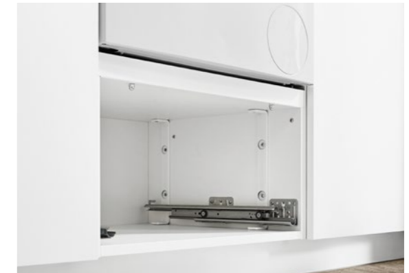
Waschmaschinen-Umbau mit TÜV-geprüfter Metallverstrebung Built-under appliance housing for washing machine with special TÜV certified metal struts