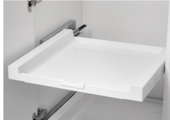
Tablarauszug Laundry-Area Tablar pull-out, laundry area