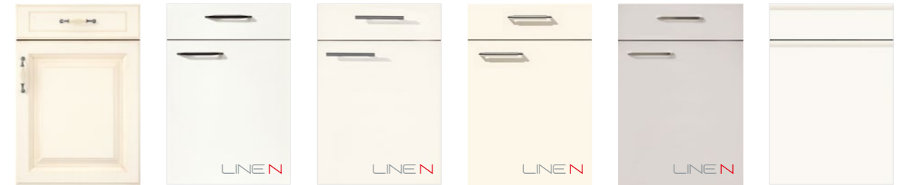
CASTELLO 390 PG 8 Lack, Magnolia gewischt LUX 817 PG 9 Lack, Alpinweiß Hochglanz LUX 814 PG 9 Lack, Weiß Hochglanz LUX 816 PG 9 Lack, Magnolia Hochglanz LUX 819 PG 9 Lack, Seidengrau Hochglanz PURA 834 PG 9 Lack, Weiß Hochglanz CASTELLO 390 PG 8 Washed ivory LUX 817 PG 9 Lacquer, alpine white high gloss LUX 814 PG 9 Lacquer, white high gloss LUX 816 PG 9 Lacquer, ivory high gloss LUX 819 PG 9 Lacquer, satin grey high gloss PURA 834 PG 9 Lacquer, white high gloss