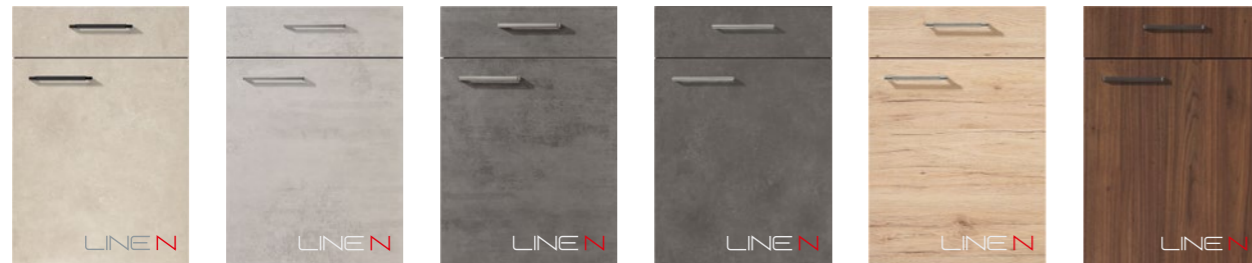
RIVA 842 Beton Sand Nachbildung PG 2 RIVA 892 Beton grau Nachbildung PG 2 RIVA 889 Beton schiefergrau Nachbildung PG 2 RIVA 839 Beton Terragrau Nachbildung PG 2 RIVA 893 Eiche San Remo Nachbildung PG 2 RIVA 840 Nussbaum Nachbildung PG 2 RIVA 842 Concrete Sand reproduction PG 2 RIVA 892 Concrete grey reproduction PG 2 RIVA 889 Concrete Slate grey reproduction PG 2 RIVA 839 Concrete Terra grey reproduction PG 2 RIVA 893 Sanremo oak reproduction PG 2 RIVA 840 Walnut reproduction PG 2