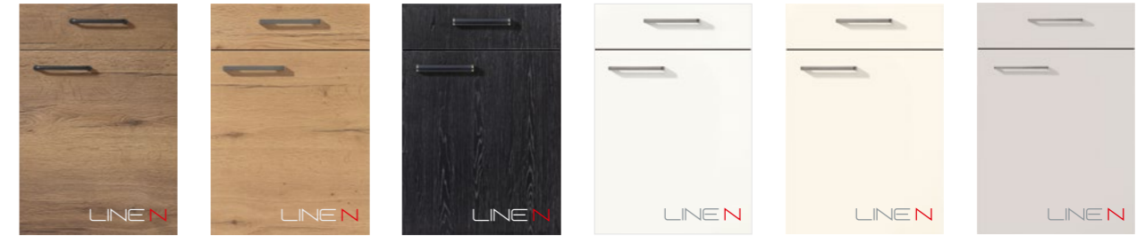
STRUCTURA 402 Eiche Havanna Nachbildung PG 3 STRUCTURA 405 Eiche Sierra Nachbildung PG 3 STRUCTURA 403 Eiche Nero Nachbildung PG 3 TOUCH 332 Lacklaminat, Alpinweiß supermatt PG 3 TOUCH 336 Lacklaminat, Magnolia supermatt PG 3 TOUCH 338 Lacklaminat, Seidengrau supermatt PG 3 STRUCTURA 402 Havana oak reproduction PG 3 STRUCTURA 405 Sierra oak reproduction PG 3 STRUCTURA 403 Nero oak reproduction PG 3 TOUCH 332 Lacquered laminate, alpine white supermatt PG 3 TOUCH 336 Lacquered laminate, ivory supermatt PG 3 TOUCH 338 Lacquered laminate, satin grey supermatt PG 3