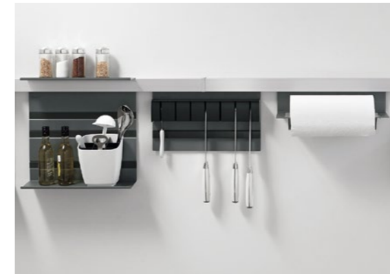
Relingsystem Linero-MosaiQ Railing system Linero-MosaiQ