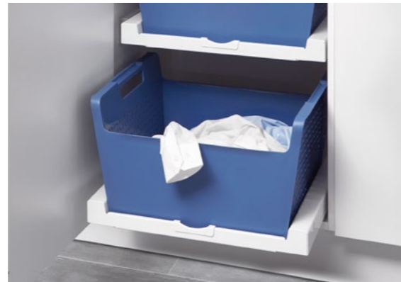
Wäschekorb Laundry-Area Laundry basket, laundry area