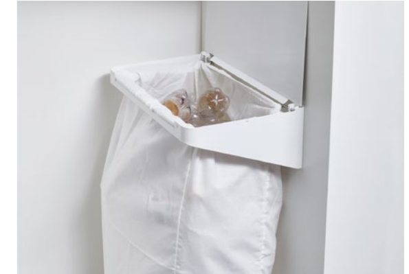
Wertstoff-Depot mit Baumwollsack Laundry-Area Recycling collector with cotton sack, laundry area